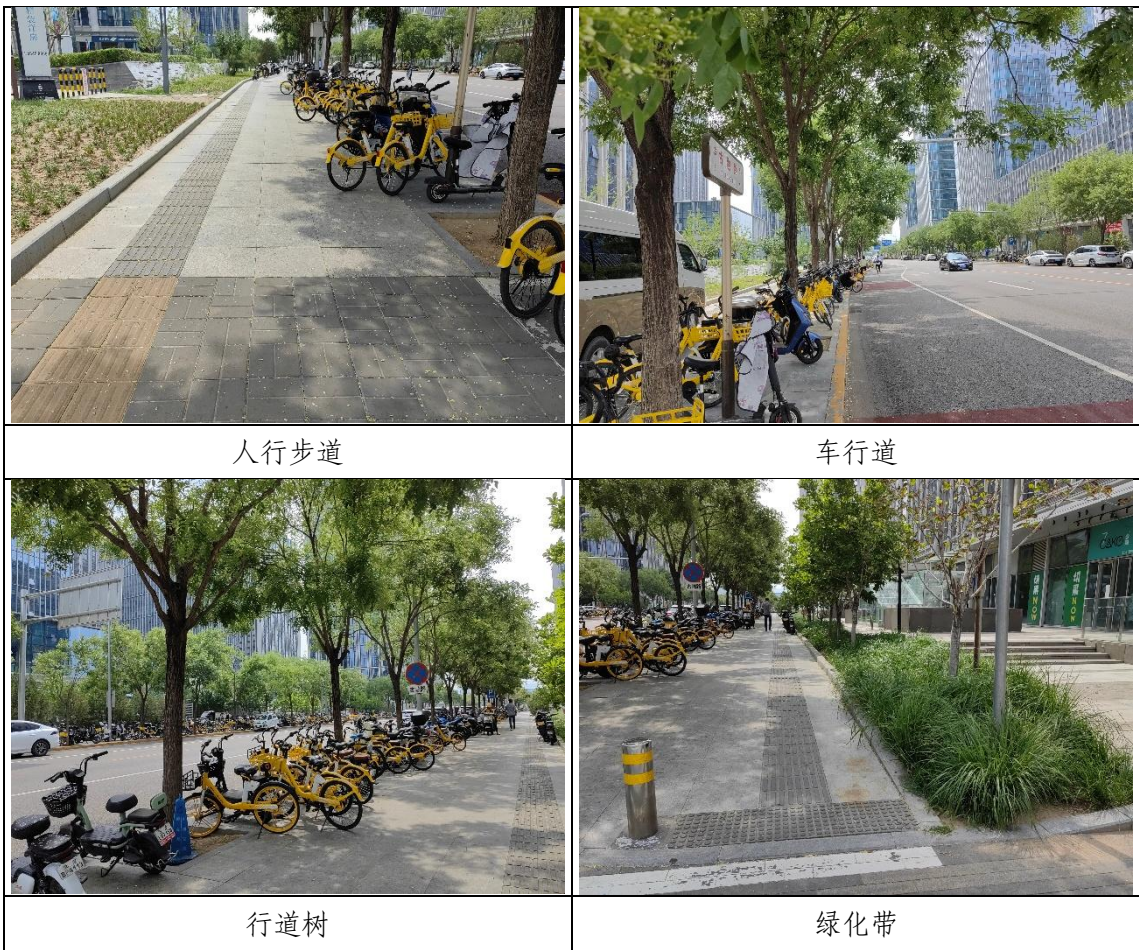
图 1.1-3 道路现状照片

绿化带面积为 1700m 2 ，采用乔、灌、草结合的方式进行绿化，植物品种选择符合绿化带特点及当地适生且景观效果良好的树草种。