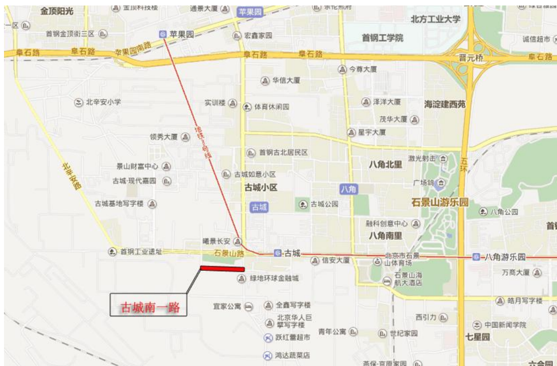
图 1.1-1 项目地理位置图